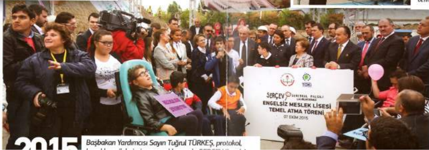
Başbakan Yardımcısı Sayın Tuğrul TÜRKEŞ, protokol.