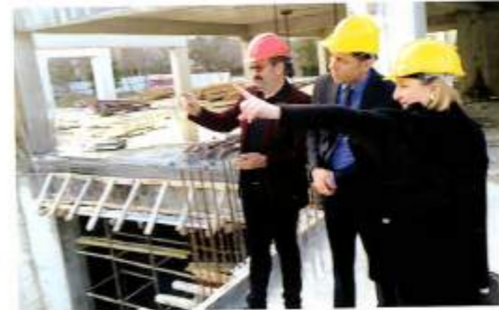
Başkanımız Sn. E. Sinem ERSOY, çalışmalarını yerinde inceledi.