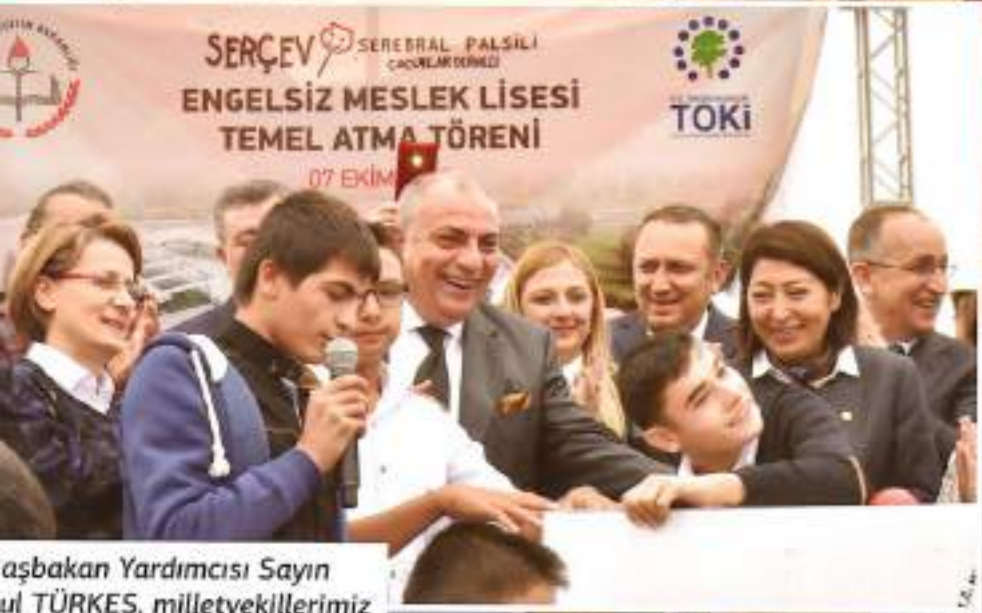
Başbakan Yardımcısı Sayın Tuğrul TÜRKEŞ, milletvekillerimiz Yönetim Kurulu Üyelerimiz çocuklarımızla birlikte.