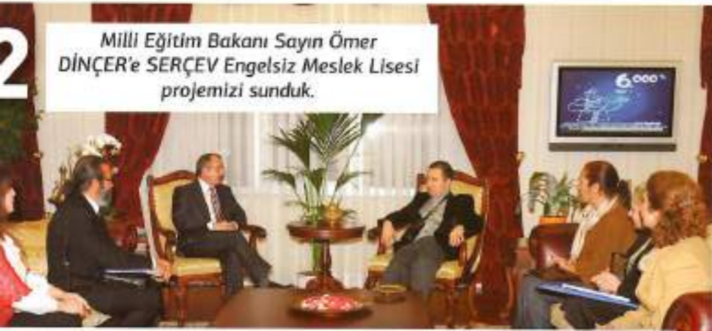
2 Milli Eğitim Bakanı Sayın Ömer DİNÇER'e SERÇEV Engelsiz Meslek Lisesi projemizi sunduk.

SERÇEV SEREBRAL PALSİLİ ÇOCUKLAR DERNEĞİ