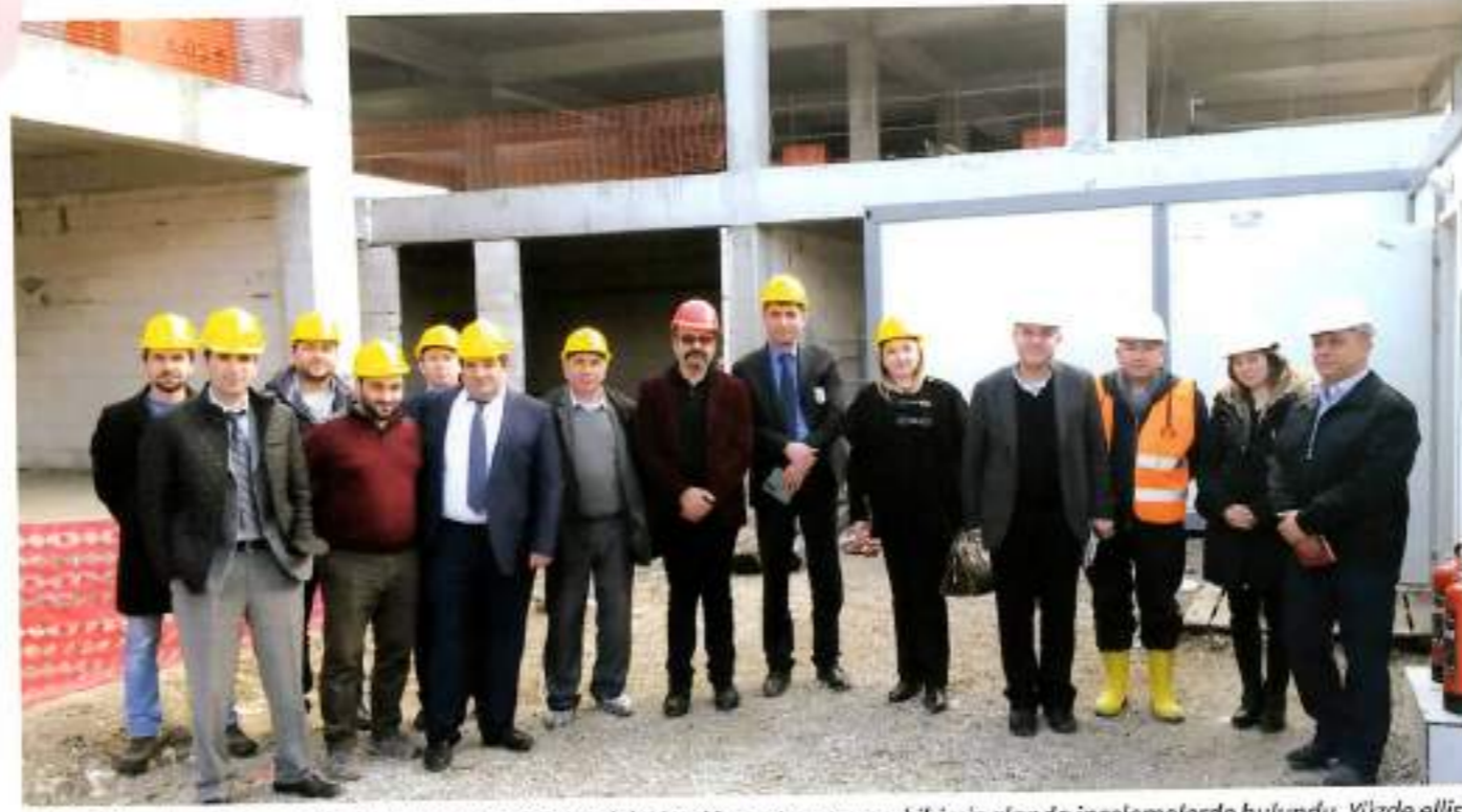
2015 Ekim ayında inşaatına başlanan Engelsiz Meslek Lisesi inşaatını gezen ekibimiz alanda incelemelerde bulundu. Yüzde ellisi bitmiş durumda olan okul inşaatı 2016-2017 eğitim-öğretim yılına hazırlanıyor. - 2016 -